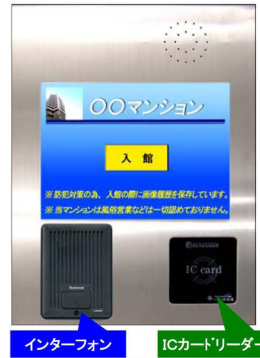
インターフォン ICカードリーダー